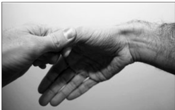
Figura 3: Maniobra de Filkelstein.

El tratamiento inicialmente es conservador. Si éste fracasa, se realiza tratamiento quirúrgico mediante apertura de la primera corredera. Existen múltiples tipos de incisión, pero lo más