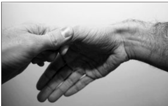
Figura 3: Maniobra de Filkelstein.

El tratamiento inicialmente es conservador. Si éste fracasa, se realiza tratamiento quirúrgico mediante apertura de la primera corredera. Existen múltiples tipos de incisión, pero lo más