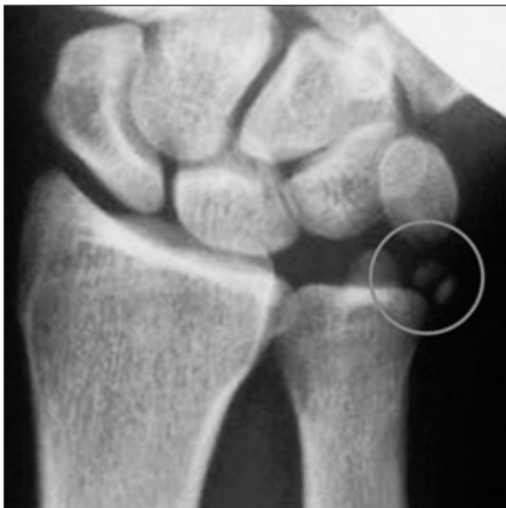
Figura 1: Tendinitis calcificante FCR.

Se define como el bloqueo tendinoso por estenosis a nivel de la polea A1, por el pinzamiento mecánico de los flexores al atravesar una polea retinacular estrechada a la altura de la cabeza del metacarpiano. Habitualmente existe un nódulo palpable que se mueve con la flexo-extensión del dedo, a diferencia de lo que ocurre con un quiste de vaina sinovial. Anatómo-patológicamente se postula la posibilidad de que se trate de una metaplasia fibrocartilaginosa 6 , ya que observamos condrocitos y colágeno tipo III en estas poleas A1 patológicas.