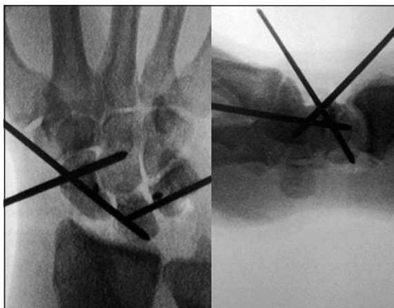
Figura 1: Tratamiento de lesión perilunar con reducción abierta y fijación interna más reparación capsuloligamentosa.