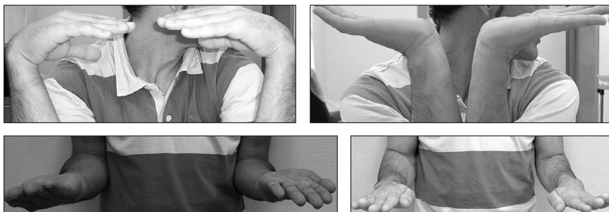
Figura 5: Resultado a las 9 semanas tras la cirugía.

en cuenta, ante la existencia de dolor en el lado cubital de la muñeca 10 . Dolor que puede ser incapacitante, por la limitación que origina para la pronación y la supinación 11 .