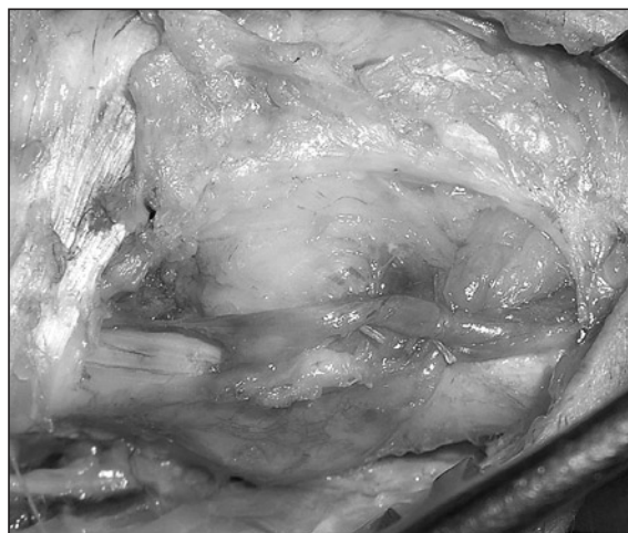
Figura 4: Reconstrucción de la vaina osteofibrosa.

bilización del tendón, se abrió longitudinalmente la corredera del ECU, a nivel del margen radial de su inserción, en el surco del tendón sobre el extremo distal del cúbito ( Figura 2 ), reinsertándola nuevamente, previa cruentación ósea del margen radial, para profundizarlo y favorecer así la unión de la vaina al hueso, con dos mini arpones reabsorbibles de 1,3mm Microfix de Mittek® y sutura irreabsorbible de 3/0 de Ethibon ( Figuras 3, 4 ), con posterior cierre anatómico de la corredera propia del ECU y del LAD.