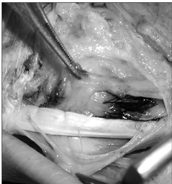
Figura 2: Incisión sobre el margen radial.

extensor, a través de una incisión longitudinal sobre su lado cubital, habiendo localizado y respetado previamente la rama sensitiva dorsal del nervio cubital. Se observó, como la vaina osteofibrosa propia del tendón ECU, situada en profundidad al LAD, se encontraba distendida y con aspecto inflamatorio ( Figura 1 ), lo que permitía, que el tendón del ECU, se desplazase libremente dentro de esta vaina, con los movimientos de pronosupinación. Para la reconstrucción y esta-