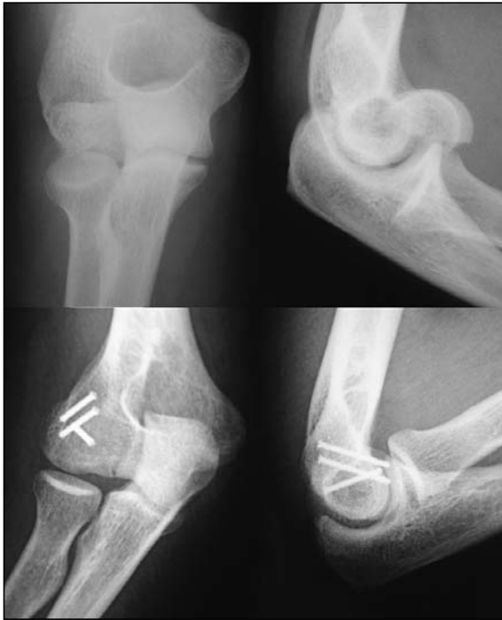
Figura 2. Fractura tipo I (Hahn-Steinthal) desplazada de cóndilo humeral. Osteosíntesis con tornillos canulados postero-anteriores.

De los dieciséis casos, nueve fueron hombres y siete mujeres. La edad media fue de 44,8 años (rango: 26-79). El lado derecho fue el afectado en 11 casos (68,75%) y el izquierdo en 5 casos (31,25%). Cuatro de los casos presentaron lesiones asociadas, uno con fractura de diáfisis humeral homolateral, otro con fractura de radio distal homolateral y dos con fractura de cabeza del radio homolateral. La etiología fue una caída casual en 13 casos (81,25%), una caída desde altura en un caso (6,25%) y accidente de tráfico en dos pacientes (12,5%). En cuanto al tipo de fractura, seis casos (37,5%) fueron Tipo I, uno de ellos asoció fractura de la cabeza del radio; un caso (6,25%) fue Tipo II y; ocho casos (50%) fueron tipo IV, uno de ellos con conminución de la tróclea que no permitió la osteosíntesis pero sí del capitellum y otro con fractura de cabeza de radio. No hubo ningún caso Tipo III. Se ha incluido en la serie un caso (6,25%) que presentó una fractura aislada de tróclea humeral en el plano coronal.