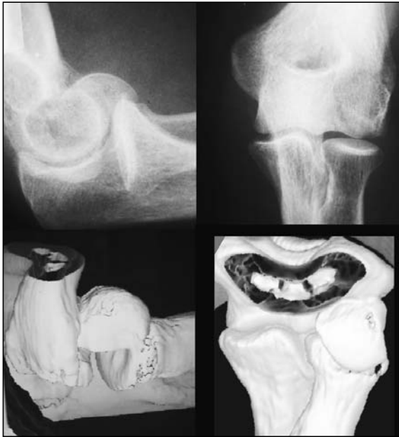
Figura 5. Comparación de imagen de fractura Tipo I en la radiología simple en el TAC.

Es controvertido extraer conclusiones acerca del tratamiento de este tipo de fracturas o determinar cual es el más adecuado, ya que la experiencia que se puede acumular de forma individual es escasa. Son lesiones de difícil diagnóstico sobre todo los casos Tipo II en los que debido al pequeño tamaño del hueso subcondral del fragmento puede pasar desapercibido con el estudio radiológico convencional. La proyección lateral correctamente realizada permite el diagnóstico en la mayoría de las fracturas como lo demuestra nuestra serie en la que tan solo fue necesaria la realización de TAC en 6 casos.