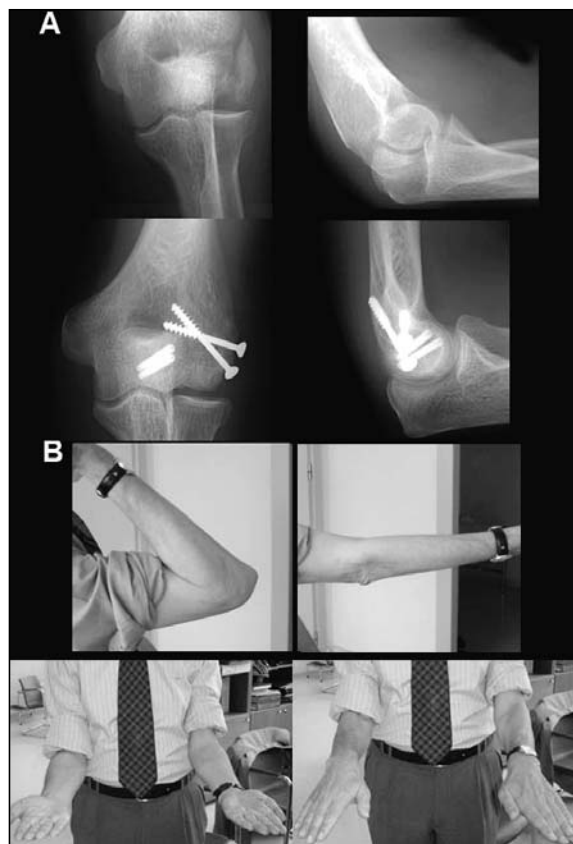
Figura 4. A. Fractura tipo IV asociada a fractura sagital del epicóndilo. Osteosíntesis con tornillos canulados Miniacutrak® del capitellum y tornillos AO pequeños fragmentos en epicóndilo. B. Resultado funcional de la lesión al final del seguimiento.

Todos los pacientes se incorporaron a su actividad laboral previa en un tiempo medio de 11 semanas (rango: 3-19), dependiendo del tipo de trabajo que realizasen. Los dos casos de artrolysis también se incorporaron a su actividad pero tras un período de tiempo más prolongado.