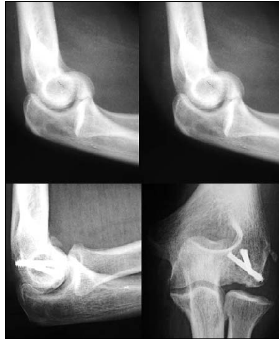
Figura 3. Fractura tipo I (Hahn-Steinthal) desplazada. Osteosíntesis antero-posterior.

Todos los pacientes fueron intervenidos por el mismo cirujano (FGL) y el tiempo transcurrido desde la lesión hasta la osteosíntesis fue 4,3 días de media (rango: 0-13). El abordaje