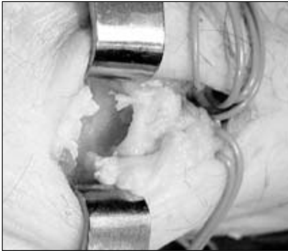
Figura 4: Visión del fresado de la cúpula en el trapecio.