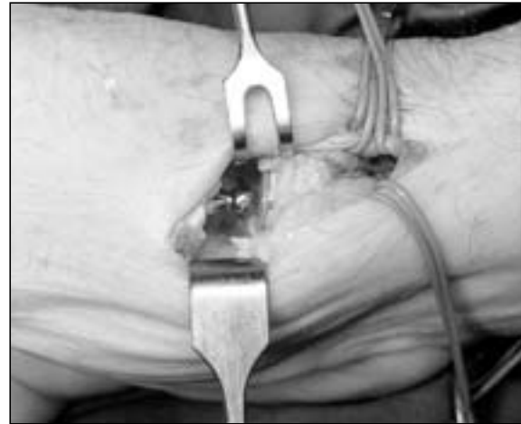
Figura 5: Resultado final de la artroplastia tipo ARPE®.

neutro en sentido palmar o dorsal. El cotilo definitivo para implantarlo nos ayudamos de dos pinzas de Kocher y una vez centrado lo impacamos en la dirección deseada, siempre abrazando el trapecio con los dedos del ayudante para evitar problemas de rupturas o estallidos (Figura 5). Después, se comprueba la estabilidad y la movilidad del implante definitivo. Cierre por planos reconstruyendo la cápsula articular, drenaje aspirativo y piel con sutura reabsorbible.