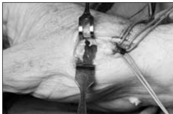
Figura 3: Visión de la trapezio-metacarpiana tras la osteotomía del metacarpiano.