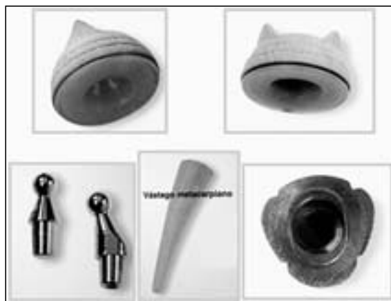
Figura 1: Componentes de la artroplastia ARPE®.

Para la evaluación de las radiografías preoperatorias se utilizó la clasificación de Eaton-Litler 7 de las muñecas intervenidas, 131 muñecas (93,6%) tenían una artrosis TMC tipo III y 9 muñecas (6,4%) tenían una artrosis TMC tipo IV. Se midió la subluxación TMC inferior de la carilla articular de la base del primer metacarpiano, para ello en una proyección radioló-