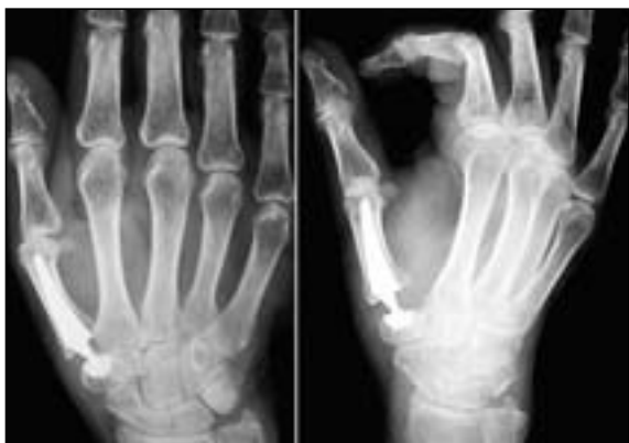
Figura 6: Resultado radiológico de la artroplastia tipo ARPE®.