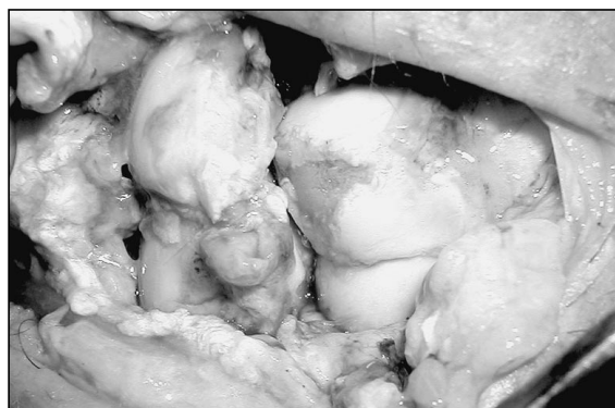
Figura 1. Campo quirúrgico de un abordaje dorsal de una luxación transescafo-perilunar donde se observa una gran lesión osteocondral que precisó una artrodesis de las 4 esquinas.

El diagnóstico original fue 9 muñecas SNAC, 5 muñecas SLAC, 2 necrosis del hueso grande, 2 inestabilidades mediocarpianas y 2 secuelas postraumáticas (luxaciones perilunares). En estas últimas la artrodesis se realizó en un caso de luxación transescafo-perilunar, en el