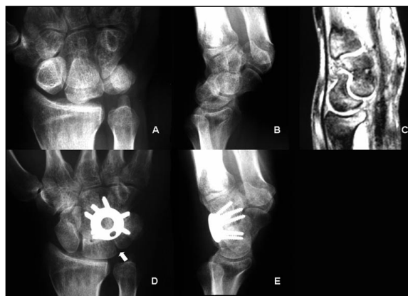
Figura 4. A y B: Imágenes radiológicas simples de una inestabilidad mediocarpiana grave. C: Corte coronal de RM del mismo paciente. D y E: Control tras la artrodesis de cuatro esquinas sin extirpar el escafoides carpiano. Todas las articulaciones que rodean al escafoides están indemnes. Nótese como se respeta en la artrodesis la unión entre el semilunar y el piramidal, para no dañar la unión ligamentosa y cartilaginosa proximal, y dejar un cóndilo carpiano liso (señalado por una flecha). En la proyección lateral se observa una correcta alineación de la unión entre el semilunar y el hueso grande corrigiendo el VISI.

la unión de la fusión de las cuatro esquinas, en el fondo del defecto raspado. Si el escafoides está muy escleroso, como sucede con frecuencia en la muñeca SLAC ( Figura 2A y 2B ), o si se conserva parcialmente (muñeca SNAC), o totalmente, recurrimos con frecuencia a injerto esponjoso de cresta iliaca. Posteriormente se alinea la placa con precaución de que el borde proximal de la misma no protruya y origine un choque con el reborde dorsal del radio. Se fija posteriormente con tornillos, con cuidado tanto en el brocado como en la medición de la longitud de los tornillos destinados al hueso piramidal. Esto se debe a que una longitud o brocado excesivo puede ocasionar una lesión condral de la articulación piso-piramidal. Después de colocar la placa, volvemos a introducir abundante injerto esponjoso por el orificio central de la placa para no dejar ningún espacio sin rellenar ( Figura 5 ). Se realiza control fluoroscópico para comprobar la posición de la placa y los tornillos, así como pruebas de movilidad para comprobar la estabilidad de la placa. Se cierra por planos y se inmoviliza con una férula durante tres semanas, para que cicatricen las partes blandas y comience la consolidación ósea.