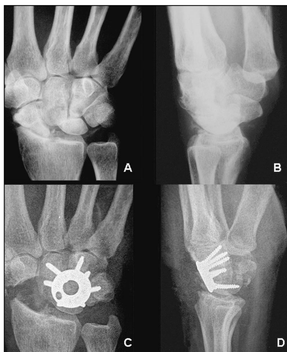
Figura 2. A y B: Muñeca SLAC, radiología preoperatorio con intensa artrosis periescafoidea y escafoides muy escleroso, que no permite una fuente adecuada de injerto. C y D: Radiología postoperatoria donde se observa que se ha realizado una extirpación completa del escafoides carpiano y se ha obtenido la consolidación.

del radio al tercer metacarpiano y la longitud del tercer metacarpiano 3 . Se considera que la artrodesis está consolidada radiológicamente cuando existe paso de trabéculas, cuando no hay rotura del material de osteosíntesis y existe buena integración del material de osteosíntesis sin osteólisis alrededor de los tornillos. No se hizo TAC de control sistemático salvo en situaciones dudosas para evidenciar la consolidación.