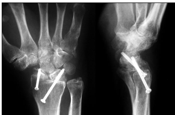
Figura 3: Radiografías anteroposterior y lateral del paciente reintervenido por excesiva longitud del tornillo.

pacio articular, sin que se observara ningún caso de aparición de cambios degenerativos en dicha articulación. Tampoco hubo ningún paciente que presentara ni clínica ni radiológicamente conflicto cubitocarpiano.