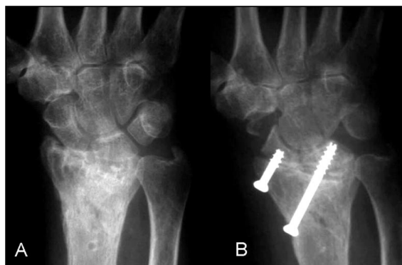
Figura 2: Artrosis radiocarpiana secundaria a una fractura del radio distal. A) radiografía anteroposterior preoperatoria. B) Control radiográfico a los 6 meses de realizar una artrodesis radioescafosemilunar.

La movilidad media obtenida fue de 45° de extensión (rango 52-30), 36° de flexión (rango 45-22), 26° de desviación cubital (rango 35-15) y 15° de desviación radial (rango 20-8), y en