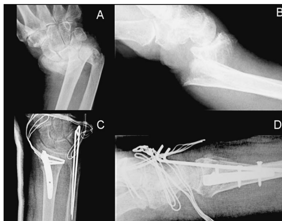
Figura 4: Fractura conminuta intraarticular del extremo distal del radio tratada con síntesis interna con Micronail®. A y B) Radiografías iniciales anteroposterior y lateral, respectivamente. C y D) Radiografías postoperatorias anteroposterior y lateral, respectivamente.

Este montaje permite la introducción de los tornillos distales a través de las guías correspondientes. Estos tornillos, en número de tres, estabilizan los fragmentos y mantienen la fractura en posición anatómica. El primer tornillo a introducir, el más distal, debe ir paralelo a la superficie articular del radio, a una distancia máxima de 1,5 cm. de la misma. Los otros dos tornillos, convergentes entre sí en el plano antero posterior y divergentes en dorsal/volar, mantienen el resto de la estructura en su posición. Los tornillos distales son de compresión y roscados al implante, lo que permite realizar su función de manera eficaz, manteniendo al mismo tiempo, la estabilidad necesaria.