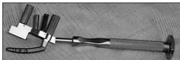
Figura 3: Guía del implante con el Micronail® a punto de ser insertado.

da la estiloides en una extensión de 1 cm. se realiza, siempre bajo control radioscópico, la introducción de una aguja de Kirschner sobre la guía que presenta a tal efecto la instrumentalización. Dicha guía debe introducirse en el canal medular paralela a la diafisis del radio y con una inclinación de 45° sobre ella. Una vez introducida la aguja, y sobre ella, se realiza la osteotomía con broca canulada, que al mantener la dirección de la aguja realiza una osteotomía ovoiforme, que permite el paso del implante. En caso necesario, esta osteotomía puede ampliarse mediante una gubia, evitando el exceso de apertura de la cortical.