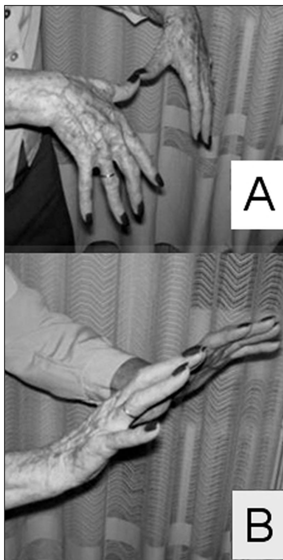
Figura 5: Resultado funcional. A) Flexión. B) Extensión.

En función de los criterios de valoración seguidos, obtuvimos un 67,56% (25) de casos excelentes, 24,32% (9) de buenos, 8,1% (3) regulares y ninguno malo. El tiempo medio de alta, con los resultados funcionales expuestos, fue