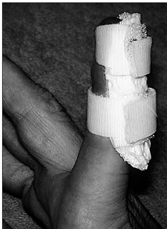
Figura 2: Férula dorsal en 5º dedo.