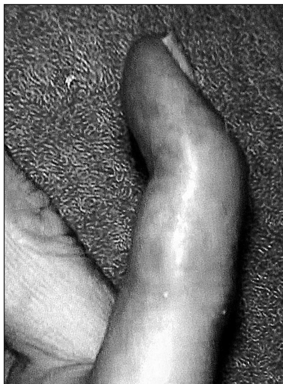
Figura: Mallet finger de 5º.

Revisamos 170 dedos en martillo consecutivos tratados ortopédicamente, excluyendo los traumatismos abiertos y las fracturas articulares que abarcan mas de 1/3 de la superficie.