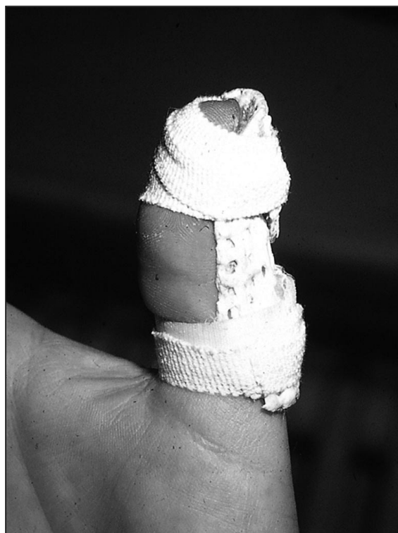
Figura 4: Férula dorsal de primer dedo.

También se utilizó como método estadístico el análisis por regresión, el mismo no permitió poner de relieve correlación entre este déficit de extensión y factores como la edad, el sexo, el segmento alcanzado, el retraso del tratamiento o la presencia de un arrancamiento óseo.