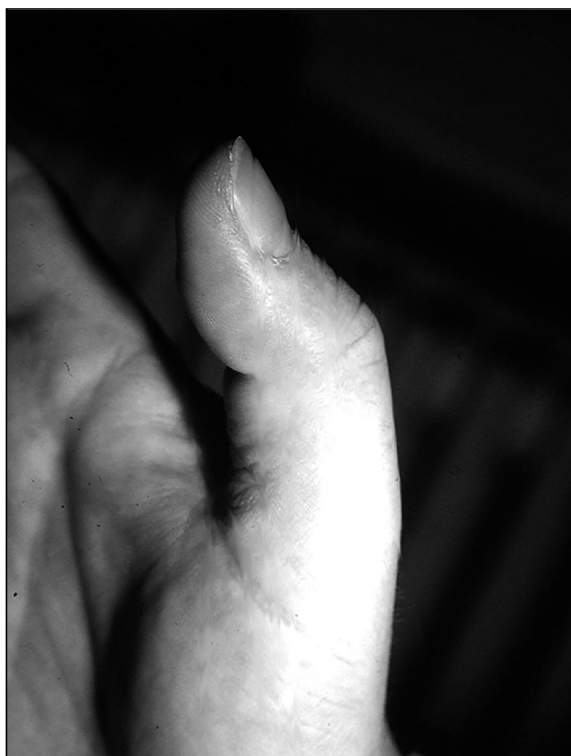
Figura 3: Mallet finger en pulgar.