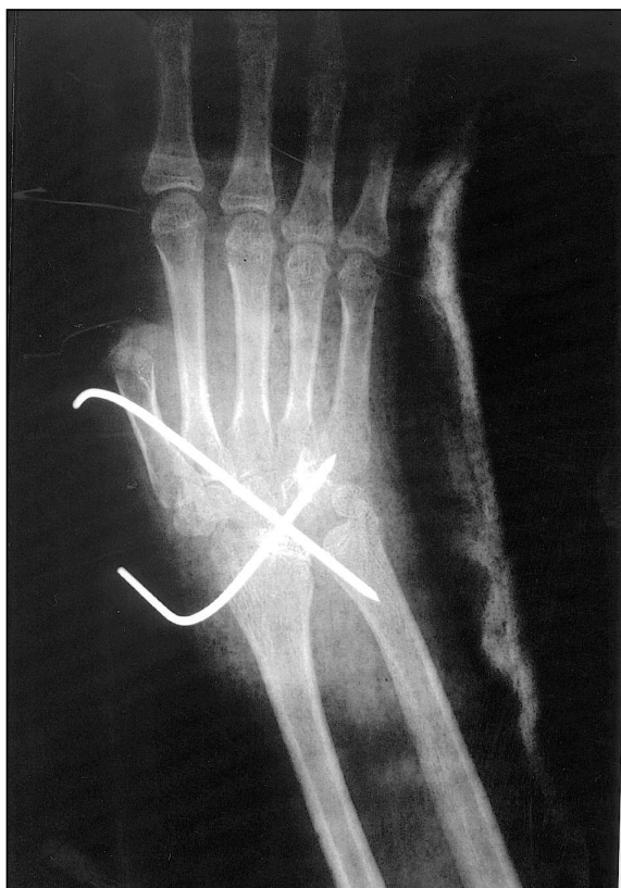
Figura 2. Radiografía que muestra la muñeca después de practicar la artrodesis, con resección de la hilera proximal del carpo, y fijación con dos agujas de Kirschner.

seca el cartílago articular del radio y del carpo, dejando la prominencia del hueso grande (os capitata), que al extender la muñeca se introduce dentro de un orificio previamente practicado en la epífisis distal del radio, con lo que se favorece la fusión (Minguella, J., 1979). Se mantiene la posición con unas agujas de Kirschner o con unas grapas, si se ha agotado ya la fisis del radio ( Figura 2 ). La posición ideal es de una extensión neutra y discreta inclinación cubital; sin embargo cuando debe utilizarse una silla de ruedas o cuando esta mano debería utilizarse para la higiene personal, es mejor dar un poco de flexión palmar, de unos 20°. Se ha realizado la artrodesis de muñeca en 7 manos, una de ellas atetósica, y a una edad entre 11 años y 16 años 9 meses, con una edad media de 15 años 4 meses. Ninguna de estas manos era funcional y sólo 2 eran capaces de extender activamente los dedos con la muñeca en flexión.