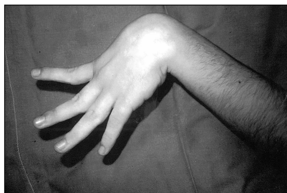
Figura 1. La mano es capaz de extender los dedos con la muñeca en flexión.

2) Artrodesis de la muñeca, que se ha practicado con resección de la hilera proximal del carpo, a fin de relajar la tensión palmar. Se re-