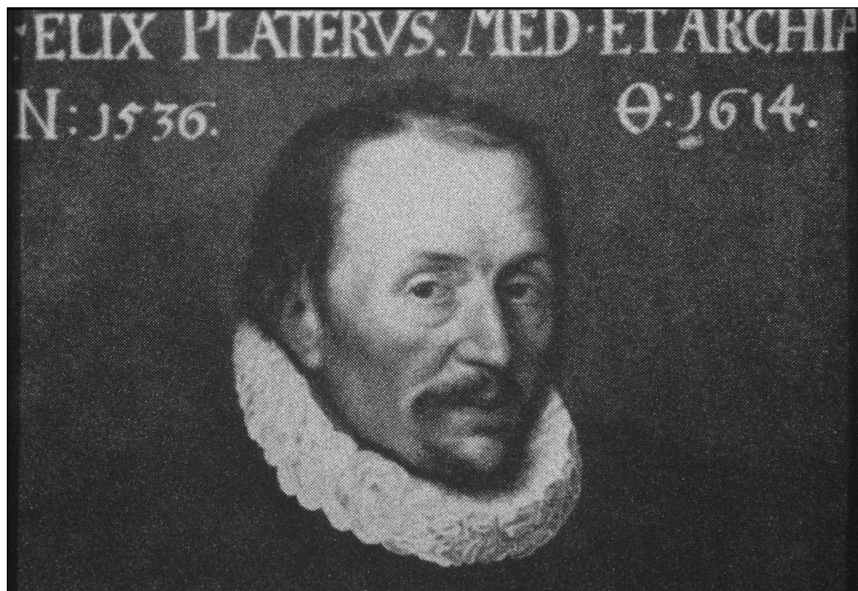
Figura 1. Félix Plater (1536-1614). Retrato realizado por von Hans Bock d. Ä. (1550-1624).

anular y meñique de tal manera que libres de sus vínculos quedaron elevados, formando dos cuerdas tensas bajo la piel, estos dos dedos permanecieron contraídos y traccionados para siempre.