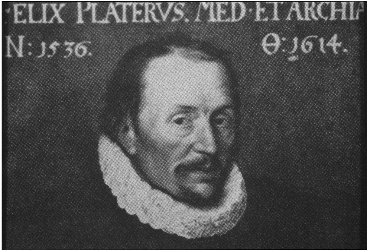
Figura 1. Félix Plater (1536-1614). Retrato realizado por von Hans Bock d. Ä. (1550-1624).

anular y meñique de tal manera que libres de sus vínculos quedaron elevados, formando dos cuerdas tensas bajo la piel, estos dos dedos permanecieron contraídos y traccionados para siempre.