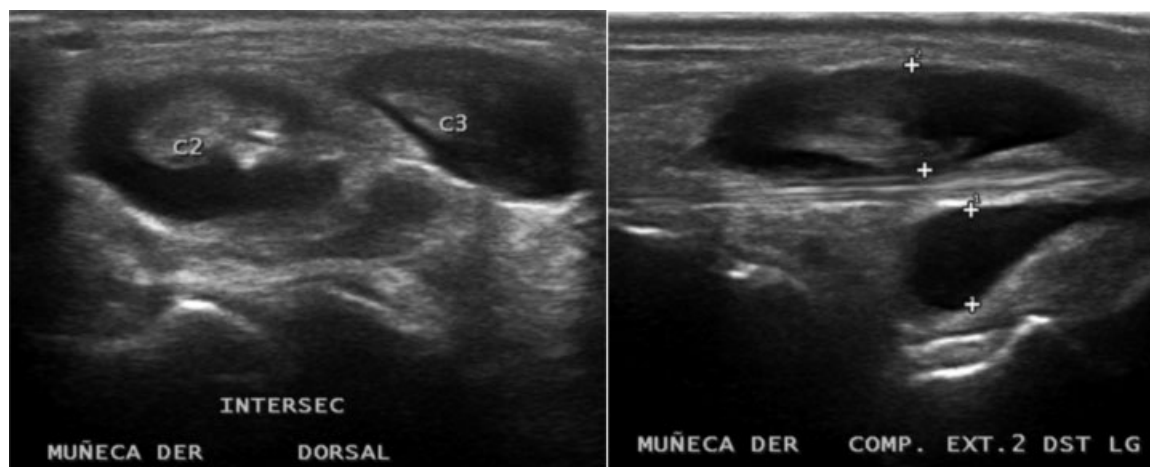
Fig. 2 Ecografía de Partes Blandas de la Muñeca Derecha. Se describe engrosamiento de tendones extensores de segundo y tercer compartimento extensor con distensión de vainas sinoviales y aumento del líquido peritendíneo.