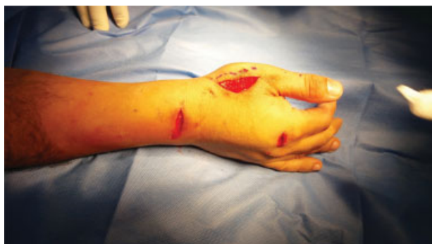
Fig. 4 Cirugía de Transposición del Tendón Extensor Propio del Índice al Tendón Extensor Largo del Pulgar con Técnica WALANT.