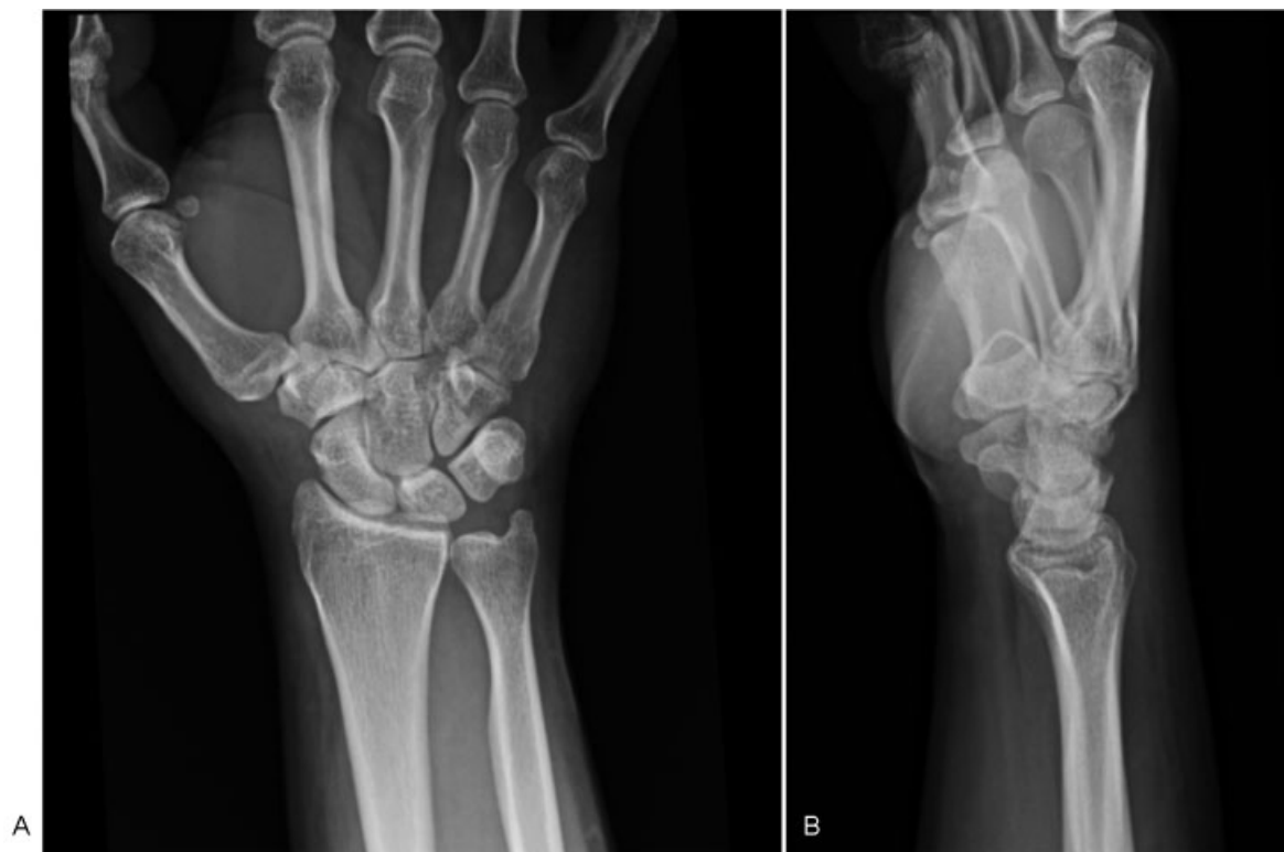
Fig. 1 Radiografía AP (A) y L (B) de la Muñeca Derecha. Radiografía se considera normal, sin encontrarse alteraciones anatómicas ni deformidades que pudiesen favorecer la rotura del ELP.

Se indica cirugía de transposición tendínea al tendón propio del índice la cual se realiza 6 semanas posteriores al inicio de la sintomatología del paciente.