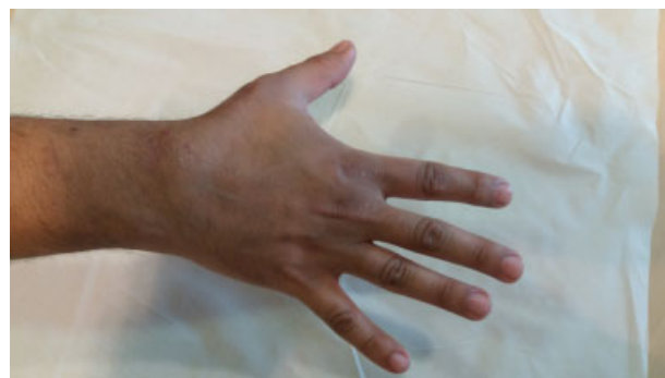
Fig. 6 Extensión activa a las 6 semanas.

deformidades en la cortical dorsal, factor asociado a la rotura espontánea. 4