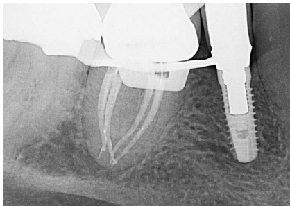
Abb. 4. 1 Wurzelfüllungskontrolle nach warm-vertikaler Kondensation.

Feilenwechsel wurde eine Patency-Kontrolle vorgenommen. Das Ergebnis nach chemomechanischer Aufbereitung (Spülung mit Zitronensäure, NaOCl, Ethanol,