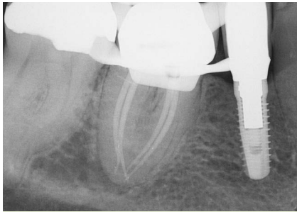
Abb. 3 Masterpointaufnahme nach abgeschlossener Aufbereitung mit 4 30iger Masterpoints.