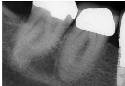
Abb. 1 Ausgangsaufnahme 46 - Verdacht auf apikal konfluierende Kanalsysteme.

1. Behandlungstermin: Der Patient wurde nach einer Schmerzbehandlung an Zahn 46 mit einer akuten apikalen Parodontitis zur weiteren endodontischen Behandlung überwiesen. Die Ursache der Beschwerden ist unter Umständen in einem Präparationsstrauma zu suchen. Die Kronenversorgung war erst 8 Monate alt und einwandfrei. In der präendodontisch von uns angefertigten Ausgangsaufnahme (Abb. 1) ist ein apikal dezent erweiterter Parodontalspalt sichtbar. Im apikalen Wurzel Drittel sind die Kanalverläufe nicht mehr eindeutig zu verfolgen. Sowohl die mesiale als auch die distale Wurzel münden scheinbar in einem Apex. Erschwerend kam noch hinzu, dass der Zahn (ausgemessen am