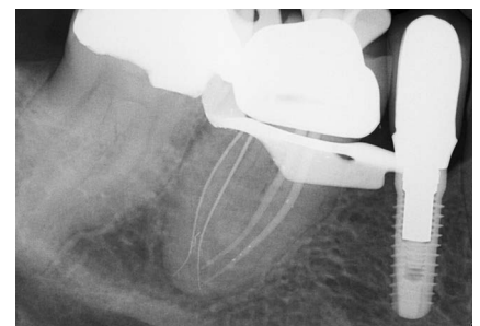
Abb. 2 Messaufnahme mit Guttaperchapoints mesial und 10er Instrumenten distal. Es sind deutlich 4 Kanalsysteme zu differenzieren.

2. Behandlungstermin: Schon 14 Tage später konnte die Behandlung bei einem vollkommen beschwerdefreien Patienten fortgesetzt werden. Nach erneuter Leitungsanästhesie (UDS forte, Sanofi-Aventis, Frankfurt/M.) und Anlegen von Kofferdam wurde eine 1. Messaufnahme zur genauen Verlaufskontrolle der Kanalsysteme angefertigt. Distal sind 10er K-Feilen (17325.654.010, Komet) und mesial 4% konische Guttaperchapoints eingebracht (Abb. 2). Die Aufnahme zeigt, dass es im S-förmigen Verlauf des distolingualen Kanalsystems bereits zur Fraktur einer 10er-Handfeile gekommen ist. Da das Fragment problemlos passiert werden konnte, habe ich keinen Entfernungsversuch vorgenommen. Distobukkal zeigt sich die schon vermutete Konfluation mit dem mesio-bukkalen Kanalsystem. Die weitere rotierende Aufbereitung der Kanalsysteme erfolgte distal unter Zuhilfenahme des Path-Gliders 03/20, die definitive Ausformung mit der F360 04/25 (Komet) und der bereits erwähnten F6 SkyTaper mit einem 30iger Spitzendurchmesser. Bei jedem