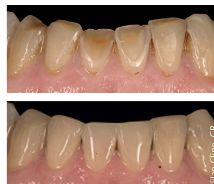
Abb. 3 Beispiel für eine Frontzahnbehandlung mit dem neuen ceram.x: Die stark geschädigte Unterkieferfrontzahnreihe wurde mit ceram.x A3 von 32 bis 43 wieder hergestellt.

grund des ausgeprägten Chamäleoneffekts schöne Erfolge (Abb. 2 und 3).