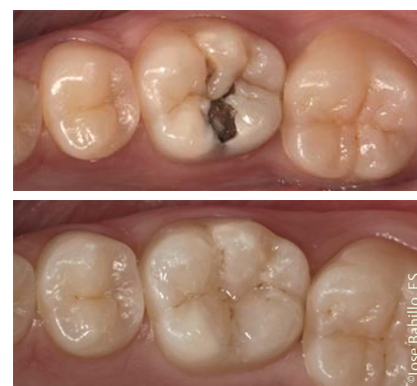
Abb. 2 Beispiel für eine Seitenzahnfüllung mit dem neuen ceram.x: Zahn 36 mit okklusaler Kariesläsion wurde mit ceram.x A2 ästhetisch versorgt.

Nach diesem Konzept lässt sich nicht nur ein 5er oder 6er, den der Patient im Alltag selten zeigt, ästhetisch ansprechend restaurieren. Auch bei Frontzähnen zeichnet das zahnärztliche Team auf-