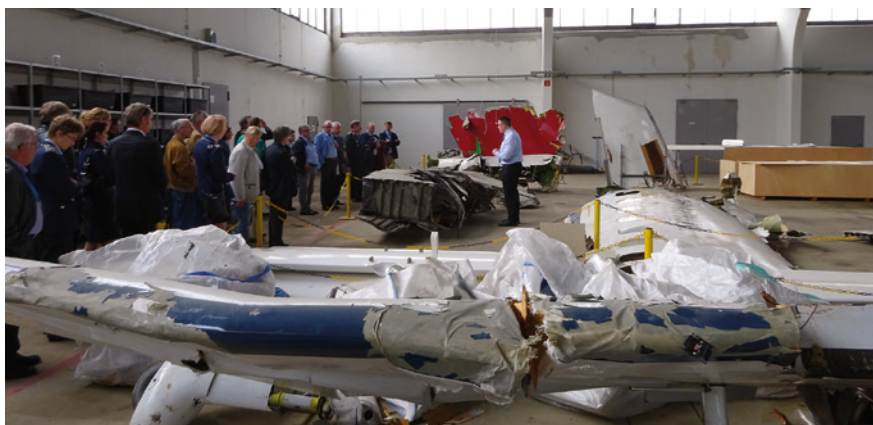
Abb. 3 Teilnehmer der Tagung im Hangar der BFU.

Das Rahmenprogramm gab uns die Möglichkeit auch einen Hauch von der Schönheit der Stadt Braunschweig zu erhaschen. Der Nachtwächter „Hugo“ hat es verstanden, uns die Besonderheiten und