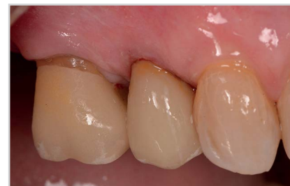
Abb. 1 a, b Vorher-Nachher-Aufnahme einer Kronenrestauration mit CERASMART (Quelle: Prof. Marleen Peumans, Belgien).

Auch die Restaurationsmaterialien haben sich im Laufe der Zeit gewandelt. Früher im Bereich der Prothetik noch weit verbreitet, ist beispielsweise die Versorgung mit Gold aufgrund gestiegener Rohstoffpreise und der unnatürlichen Optik oftmals nicht mehr erwünscht; der Patient verlangt heute nach zahnfarbenen Zahnersatz. Deshalb sind alternative Werkstoffe besonders gefragt und werden in Zukunft noch an Bedeutung gewinnen. Die digitalen Verarbeitungstechniken sind dabei besonders interessant, weil sie es ermöglichen, Materialien zu verarbeiten, die zuvor nicht im Fokus standen – wie beispielsweise Zirkon. Eine relativ neuartige Werkstoffklasse innerhalb der Keramiken bilden Hybridkeramiken wie CERASMART von GC. Das japanische Unternehmen bietet neben einer Universal-Variante des Materials auch eine für die Bearbeitung mit CEREC-Schleifmaschinen konzipierte