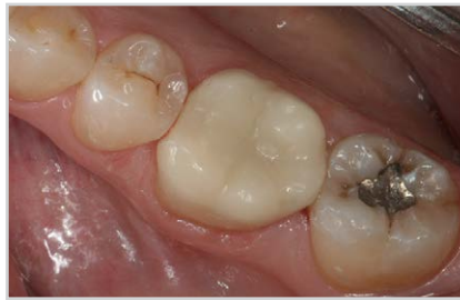
Abb. 3 a, b Vorher-/Nachher-Aufnahme eines Hybridkeramik-Inlays (CERASMART™, GC).