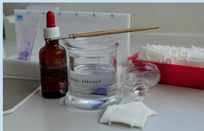
Abb. 6 Nach der Beurteilung unter dem Mikroskop wird das verwendete Immersionsöl mit Roti-Histol vom Objektträger entfernt. Die Probe kann danach archiviert oder versandt werden.