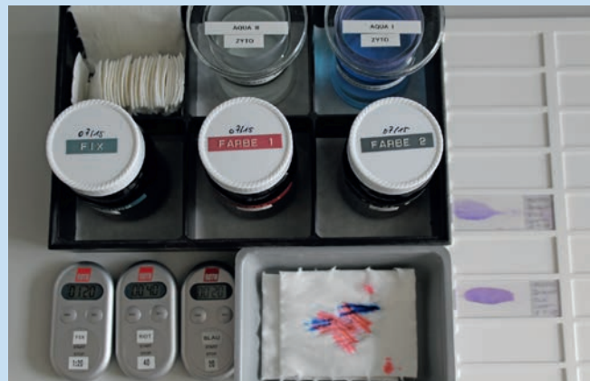
Abb. 4 Der Einsatz von Kurzzeitweckern (für jeden Arbeitsschritt einen) hat sich in der Praxis als erhebliche Arbeitserleichterung und zur Vermeidung von Fehlern als absolut vorteilhaft bewiesen.