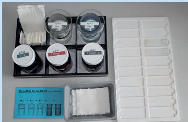
Abb. 1 Fixier- und Färbearbeitsplatz mit den beschriebenen Lösungen. Eine Kurzanleitung mit den Bearbeitungszeiten hat sich besonders bei seltenem Gebrauch oder wechselndem Personal (z. B. Nachtdienst) bewährt.

Damit wird versucht, die Färbung zu intensivieren, um die Diagnostik zu erleichtern.