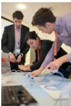
Der Hands-on-Workshop kam bei allen gut an.