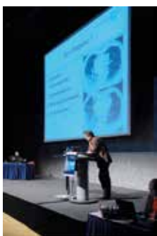
Zahlreiche renommierte Referenten konnten wieder für den RKR gewonnen werden.