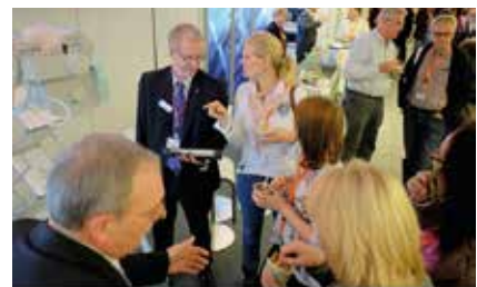
In den Pausen gab es dichtes Gedränge auf der Industrieausstellung.