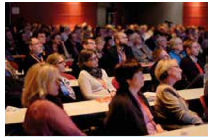
Voller Saal beim RKR.