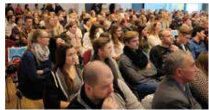
Auch die MTRA und MTRA-Schüler hatten wieder ihr eigenes Programm.