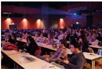
Mit großem Interesse folgten die Besucher den Vorträgen.