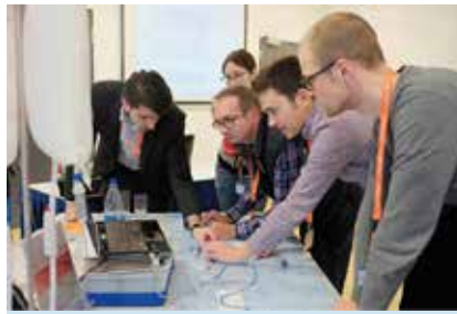
Neu in 2015: Beim Hands-on-Workshop Stroke konnten die Teilnehmer selbst Hand anlegen.