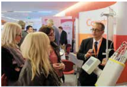
Die Industrieausstellung war ein Publikumsmagnet.

Der RKR war schon immer ein Kongress, der Menschen zusammengebracht hat. Vor allem die Vernetzung zwischen Radiologen und der Medizin-Industrie stand immer ganz oben auf der Agenda und spiegelt sich seit ehedem in der großen Industrieausstellung wieder. Viele Firmen kommen seit vielen Jahren nach Bochum, da sie den direkten Kontakt mit den Besuchern schätzen. Dazu trägt auch die Stadt Bochum zu einem nicht unerheblichen Teil bei: Am 1. Abend findet traditionell