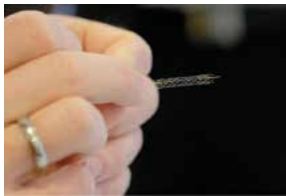
Es lebe die moderne Medizintechnik.