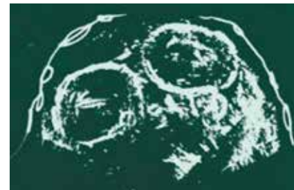
Abb. 3 Compound-Scan: Zwillinge

Zweifellos war die 1. weltweite Tagung der Ultraschalldiagnostiker in Wien 1969 die Initialzündung für die Gründung vieler nationaler Ultraschallgesellschaften, wie der DAUD, während in anderen Ländern bestehende wissenschaftliche Gesellschaften von den Ultraschalldiagnostikern weitergeführt und gewissermaßen „übernommen“ wurden, was an den „älteren“ Gründungsdaten abzulesen ist. Die treibende Kraft zur Gründung der DAUD