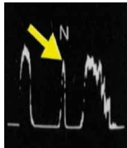
Abb. 4 A-Mode: Netzhautablösung.

Dieses Dokument wurde zum persönlichen Gebrauch heruntergeladen. Vervielfältigung nur mit Zustimmung des Verlages.