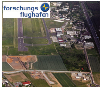
Forschungsflughafen Braunschweig – Ort unserer nächsten DGLRM-Jahrestagung.

Die Zusammenarbeit zwischen ESAM und AsMA soll aber nicht nur auf diesen einen gemeinsamen Kongress beschränkt bleiben. In den Überlegungen von AsMA und ESAM, die Kräfte in der Luft- und Raumfahrtmedizin über die Ländergrenzen hinaus zu bündeln, gibt es Bestrebungen in beiden Gesellschaften zu einer Harmonisierung flugmedizinischer Aus- und Weiterbildung sowie von Ausbildungspunkten und -stunden. Daneben denkt der Vorstand der ESAM darüber nach, wie er die Bemühungen der AsMA, die Anerkennung der Luft- und Raumfahrtmedizin als Spezialdisziplin der Medizin weltweit zu erwirken, unterstützen kann. Die AsMA hat hierzu bereits eine Arbeitsgruppe gegründet. Auch wir sollten uns diesen Entwicklungen nicht ver-