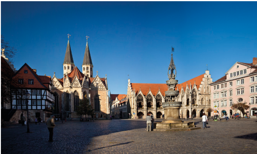
Braunschweig – Blick auf die Altstadt.

auch inhaltlich mehr auf das Gebiet der menschlichen Leistungsfähigkeit (Human Performance) und deren Verbesserung (Enhancement) ausrichten, eine Thematik, die auch hierzulande in der Flugmedizin mehr und mehr an Aktualität gewinnt.