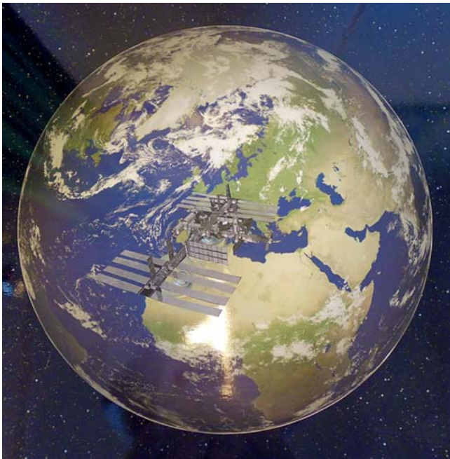
Abb. 1 Weltraumschiff ISS.