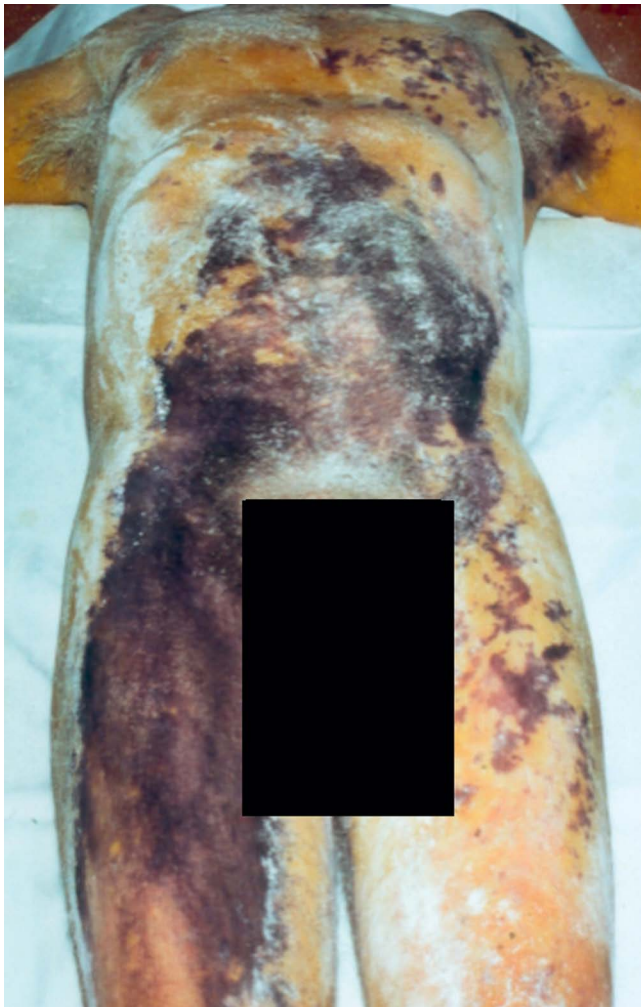
Abb. 3 Massiv alltagsbeeinträchtigende Hyperhidrose vor allem der rechten Leiste bei Ross-Syndrom (Minor-Schweißtest vor Injektion mit Botulinumtoxin).

Nutze. Zugelassen ist nur die Behandlung der krankhaften axillären Hyperhidrose für Onabotulinum Toxin A. Effektiv und möglich ist jedoch auch die Behandlung der plantaren oder fazi- alen Hyperhidrose. Letztere tritt vor allem beim Geschmacks- schwitzen („Frey-Syndrom“) durch fehlerhafte Regeneration auf: parasympathischer Fasern, die für die Speichelsekretion zuständig sind, verbinden sich mit sympathische Fasern der Schweißsekretion an der Wange [28]. Eine andere Sonderform der fokalen fazi- alen Hyperhidrose ist das Harlequin-Syndrom, bei dem zu einer halbseitigen Hautrötung und Hyperhidrose kommt – meist aufgrund kompensatorisch vermehrten Schwit- zens bei kontralateraler Anhidrose durch Schädigung der zen- tralen oder peripheren sympathischen Efferenzen. Auch beim seltenen Ross-Syndrom kommt es neben einem begleitenden Adie-Syndrom bei primärer einseitiger Anhidrose am Rumpf zu Arealen mit oft massiver kompensatorischer Hyperhidrose. Auch hier zeigten sich lokale Injektionen als wirksam [29] (◉ Abb. 3 ). Eine andere erfolgreich mit Botulinumtoxin behandelte Fehl- funktion der Schweißdrüsen ist das Farbschwitzen (Chromhid- rose) [30, 31], bei der durch Lipofuszin-Ablagerungen von braun- gelben Pigmenten farbiger – vor allem gelber, grüner, blauer oder schwarzer – Schweiß aus den apokrinen Schweißdrüsen austritt.