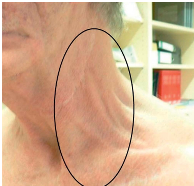
Abb. 1 Hyperkontraktiler Areal nach Pectoralis-Lappenplastik nach Operation eines Kieferkarzinoms.