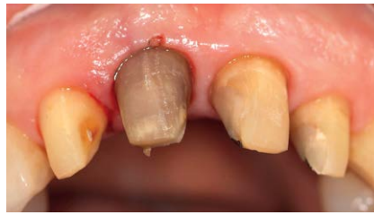
Abb. 10 Klinische Situation nach Entfernung der VMK-Kronen an 12–22.