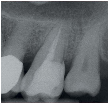
Abb. 7 Postoperatives Röntgenbild der Kompositrestauration an Zahn 27.