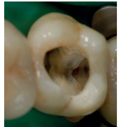
Abb. 4 Zahn 27 mit applizierter metallischer Teilmatrize.

war eine Verkeilung nicht notwendig. Wäre die Teilmatrize nicht anlegbar gewesen, so hätte man zum Beispiel auch eine metallische Vollbandmatrize (Tofflemire) verwenden können. Durch Zurechtschneiden hätte man diese an den Defekt anpassen können. Eine Adaptation der Matrize am Zahn wäre durch das Zudrehen des Matrizenhalters möglich gewesen. Auch hier hätte man ohne Verkeilung gearbeitet. Wird auf eine Verkeilung verzichtet, so ist es insbesondere wichtig, dass man ein „Überstopfen“ des Kompositmaterials in den Zahnzwischenraum vermeidet. Dies gelingt durch Verwendung von Flowkomposit. Zur Konditionierung der Zahnoberflächen war Phosphorsäure verwendet worden (Ultra-Etch, Ultradent Products, UP Dental GmbH, Köln), als Klebesubstanz ein Kombinationspräparat aus Primer und Adhäsiv (Optibond FL, Kerr GmbH, Rastatt). Als fließfähiges Material kam ein Flowkomposit zum Einsatz (TetricEvo Flow, Ivoclar Vivadent, Ellwangen), das als erste dünne Schicht in die Kavität eingebracht worden war, um einerseits ein Überstopfen zu vermeiden, und anderer-