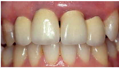
Abb. 9 Ausgangssituation mit VMK-Kronen an den Zähnen 12–22.