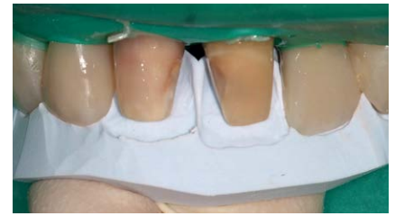
Abb. 11 Rekonstruktion der Zähne 11 und 21 mittels eines Silikonschlüssels.