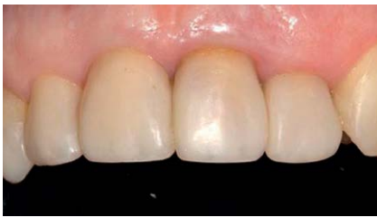
Abb. 12 Abschließende Situation nach Rekonstruktion der Zähne 12–22 mittels direkten Kompositaufbauten.