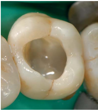
Abb. 5 Schichtweiser Verschluss der Kavität von okklusal nach interner Versorgung der distalen Wand und Vitelexstirpation. Die 1. fließfähige Schicht Komposit ist in den Zahn 27 eingebracht und lichtpolymerisiert.