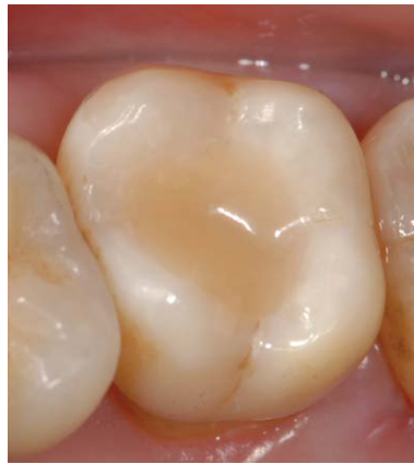
Abb. 6 Fertige Kompositrestauration an Zahn 27.