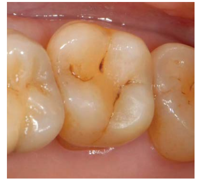
Abb. 2 Klinische Ausgangssituation: Sehr starke, lang anhaltende, spontan auftretende Schmerzen am auf den Kältetest (Kohlendioxid) hypersensibel reagierenden Zahn 27 im Sinne einer irreversiblen Pulpitis, parodontale Situation unauffällig (keine erhöhten Sondierungstiefen, kein Bluten nach Sondieren).