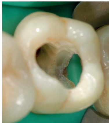
Abb. 3 Zahn 27 nach Anlegen von Kofferdam, Trepanation und Kariesexkavation im Sinne einer modifizierten Tunneltechnik.