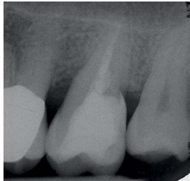
Abb. 8 Röntgenkontrollaufnahme nach 1,5 Jahren.

seits mögliche Unterschnitte und schwer zugängliche Bereiche ausfließen zu lassen (◉ Abb. 5 ). Nach Aushärtung dieser 1. Schicht ist das Risiko des oben erwähnten Überstopfens mit viskösem Material in den Zahnzwischenraum verringert. Schließlich erfolgte die schichtweise Rekonstruktion der Kavität mittels viskösem Restaurationskomposit (TetricEvoCeram, IvoclarVivadent). Abschließend wurde die Okklusion adjustiert und eine Politur durchgeführt (◉ Abb. 6 ). Die röntgenologische Kontrolle zeigte, dass ein gleichmäßiger und stufenfreier Übergang zwischen Kompositmaterial und Zahn erreicht wurde (◉ Abb. 7 ). Die Patientin wurde anschließend hinsichtlich der Anwendung von Interdentalraumbürstchen instruiert und trainiert. Eine röntgenologische Kontrollaufnahme nach 1,5 Jahren zeigte einen intakten formschlüssigen Übergang zwischen Kompositmaterial und Zahnhals (◉ Abb. 8 ). Im vorliegenden Fall kam es zu einer Verletzung der biologischen Breite im Bereich der tief subgingival reichenden Kompositrestauration. Auf dem Verlaufsröntgenbild erkennt man, dass sich das knöcherne Niveau über 18 Monate circa 1 mm unterhalb des Restaurationsrandes eingestellt hat. Eine optimale häusliche Hygiene in