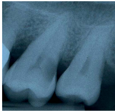
Abb. 1 An Zahn 27 erkennt man eine ausgeprägte distale Wurzelkaries.

Die Kariesexkavation erfolgte im Sinne einer modifizierten Tunneltechnik, bei der die distale Randleiste des Zahns erhalten und nur die darunter liegenden und kariös zerstörten Anteile des Zahns entfernt wurden (◉ Abb. 3 ). Diese Technik kann durchgeführt werden, wenn über einen ausreichend einsehbaren Zugang die vollständige Kariesexkavation sichergestellt werden kann. Vorteilhaft ist, dass durch den Erhalt der Randleiste eine größere Stabilität des Zahnes bewahrt wird. Zur Abdichtung des distalen Defekts wurde eine metallische Teilmatrize (Palodent, Dentsply DeTrey, Konstanz) eingeführt, die sich durch die Führung des noch bestehenden Kontaktpunkts und der mit Kofferdam eingeschlagenen Papille gut an den Zahn anlegte (◉ Abb. 4 ). Eine Verkeilung konnte nicht erfolgen, der Keil hätte die Matrize in den Bereich des subgingivalen Zahndefekts gedrückt. Dadurch, dass die Matrize jedoch anatomisch formschlüssig am Zahn anlag,