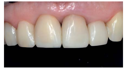
Abb. 14 Klinische Situation nach 10 Jahren und durchgeführter Farbkorrektur und Anpassung der Ebene der Inzisalkanten.