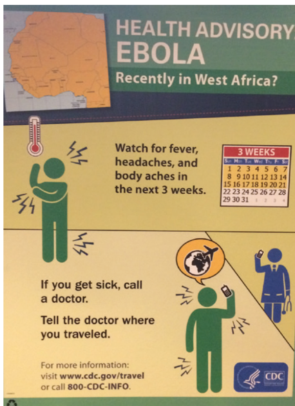
Abb. 1 Aufsteller auf der Jahrestagung der American Society of Tropical Medicine and Hygiene (ASTMH) 2014 in New Orleans.

in Texas mit der Behandlung des ersten in den USA positiv getesteten Ebolapatienten assoziierte Ansteckungen zweier Krankenschwestern sowie die Infektion der spanischen Krankenschwester sind angesichts der weniger als 2 Dutzend aus Afrika nach Europa beziehungsweise in die USA importierten Erkrankungsfälle eine doch erschreckende Bilanz.