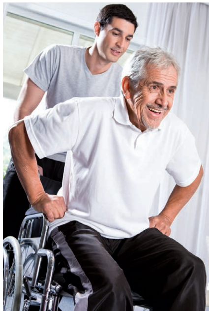
In fünf Hausbesuchen leitet der Therapeut den Patienten zu verschiedenen Übungen an.

■ Physio- und Ergotherapeuten können im Zuge des „Chronic Disease Managements“ des Hausarztes innerhalb von fünf Behandlungen dazu beitragen, das Fallrisiko von älteren Menschen zu verringern (👁 unten). Dies fanden zwei Wissenschaftlerinnen von der University of Sydney in ihrer Studie heraus.