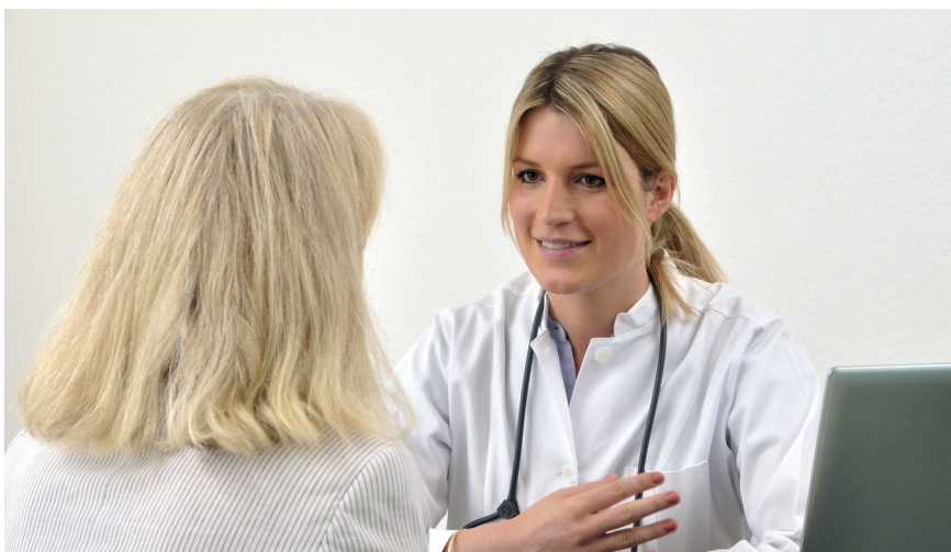
Das Multiple Myelom stellt Patienten und Ärzte immer noch vor große Herausforderungen.