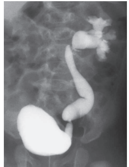
Miktionszystourethrogramm mit Darstellung eines VUR Grad IV links (Bild: Honnef D, Piroth W. Vesikoureteraler Reflux (Kind). In: Thieme Radbase).

Allerdings fand sich bei 87 Kindern, deren erstes Rezidiv von E. coli hervorgerufen worden war, in Rektalabstrichen ein hö-