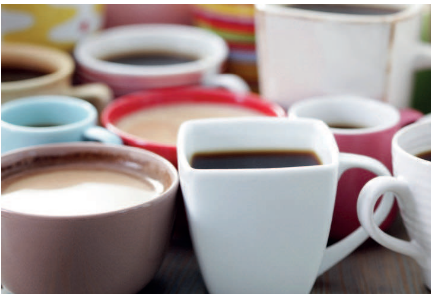
Kaffee führt bei Männern mit chronischem Beckenschmerzsyndrom häufig zu einer Verstärkung der Symptome.