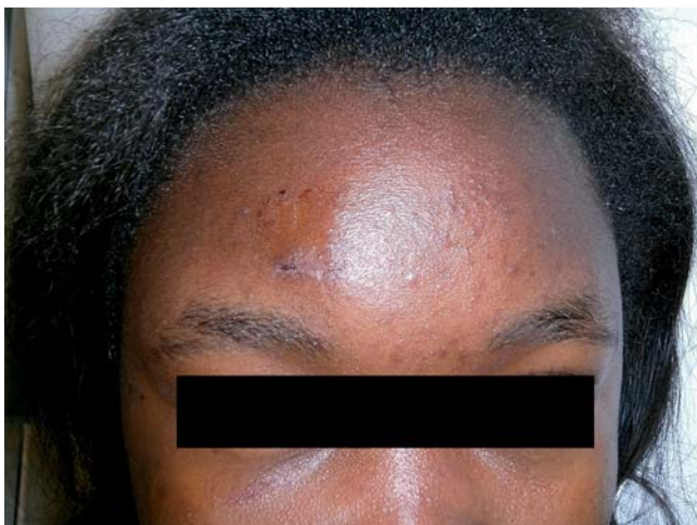
Abb. 1 Klinischer Befund postoperativ mit Akne comedonica an der Stirn.

zu gehört neben dem klassischen Onchozerkom, wie wir es in unserem Fall vorfanden, die Onchodermatitis im Verlauf. Die Erkrankung wird verursacht durch die Filarie Onchocerca volvulus und durch Kriebelmücken von Mensch zu Mensch übertragen.