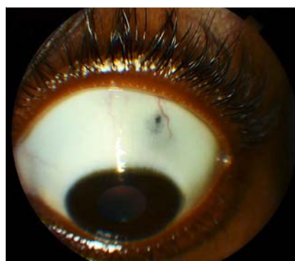
Abb. 3 Ophthalmologischer Zufallsbefund einer Zyste ohne Zusammenhang zum Onchozerkom.

Die Infektionsintensität wird mit der Anzahl der Mikrofilarien pro Milligramm Haut berechnet [1, 7]. Interessanterweise konnte gezeigt werden, dass in Proben aus Knien und der Gegend der Spina iliaca mehr Mikrofilarien nachweisbar sind als in Proben von Kopf, Schulter oder Ellbogen [8]. In unserem Fall waren in Proben aus der Spina iliaca und der Kniebeuge bei klinisch blandem Befund keine Filarien nachweisbar.