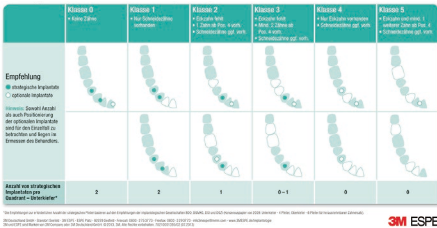
Abb. 2 Empfehlungen zur Planung der Position und Anzahl von MDI Mini-Dental-Implantaten zur Pfeilervermehrung im Unterkiefer.

messer. Zu beachten ist hierbei, dass die Belastung des periimplantären Knochens bei durchmesserreduzierten Implantaten höher ist als bei solchen mit Standarddurchmesser. Bei indirekter Kraftübertragung durch schleimhautgetragene und lediglich implantatretinierte Prothesen (Soft-Loading Konzept wie bei MDI Mini-Dental-Implantaten von 3 M ESPE) besteht jedoch keine Gefährdung durch Überlastung – dies wird durch Studienergebnisse [2–4] bestätigt, die mit konventionellen Implantaten