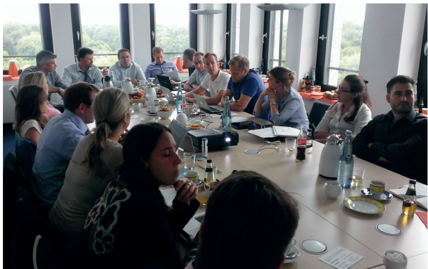
Das Junge Forum diskutierte in Berlin angeregt über bestehende und neue Projekte.

Die YOUngsters sollen weiterentwickelt werden, um den bevorstehenden und wachsenden Aufgaben gerecht zu werden. Wir freuen uns bereits jetzt, weitere interessierte Studierende für die YOUngsters