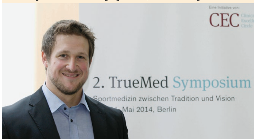
Abb. 1 Matthias Steiner, der neben vielen anderen Titeln Gold im Superschwergewicht bei den Olympischen Spielen 2008 in Peking gewann, hat in seiner Zeit als Leistungssportler kein mentales Training erhalten.