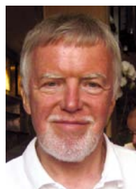
Mit den besten Grüßen

Last but not least empfehle ich die Ankündigung des Emders Workshops Ihrer Aufmerksamkeit!