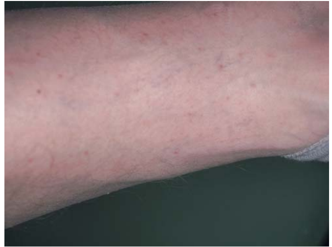
Abb. 4 Flohstiche beim Menschen.