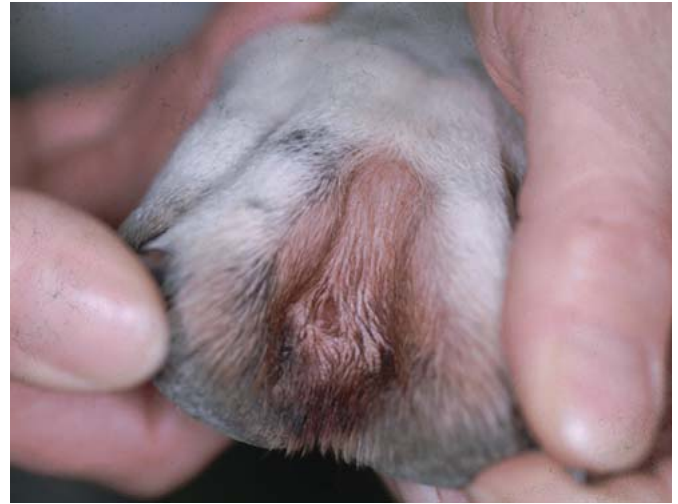
Abb. 2 Wenn die Veränderungen z. B. Lecken der Vorderpfoten inkludieren, sollten eine atopische Dermatitis oder eine Futtermittelallergie als Differenzialdiagnose in Erwägung gezogen werden.

dien in der Umgebung des Tieres befinden, hängt deren Entwicklung von den jeweiligen Umgebungsbedingungen ab. Wärmere Temperaturen, feuchtes (aber kein nasses) Klima und keine direkte Sonneneinstrahlung haben einen positiven Einfluss auf die Flohentwicklung. Im Haus und in der Wohnung spielen diese klimatischen Einflüsse jedoch keine Rolle.