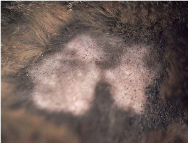
Abb. 3 Flohkot.