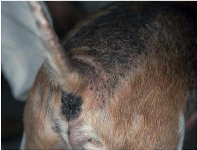
Abb. 1 Typisches klinisches Bild einer Flohallergie: Veränderungen an Kruppe und Schwanzansatz.