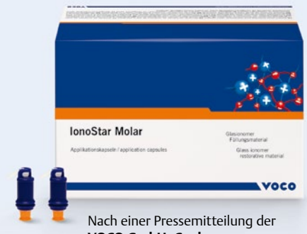
Nach einer Pressemitteilung der VOCO GmbH, Cuxhaven Internet: www.voco.de

sche wie haltbare Restaurationen schnell und einfach herstellen. IonoStar Molar eignet sich für Füllungen von nicht okklusionstragenden Kavitäten der Klasse I, semipermanente Füllungen von Kavitäten der Klasse I und II, Füllungen von Zahnhalsläsionen, Klasse-V-Kavitäten, Behandlung von Wurzelkaries, Füllungen von Klasse-III-Kavitäten, Restauration von Milchzähnen, als Unterfüllung bzw. Liner, für den Stumpfaufbau sowie für temporäre Füllungen.