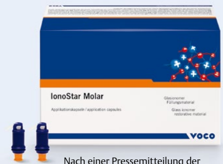
Nach einer Pressemitteilung der VOCO GmbH, Cuxhaven Internet: www.voco.de

sche wie haltbare Restaurationen schnell und einfach herstellen. IonoStar Molar eignet sich für Füllungen von nicht okklusionstragenden Kavitäten der Klasse I, semipermanente Füllungen von Kavitäten der Klasse I und II, Füllungen von Zahnhalsläsionen, Klasse-V-Kavitäten, Behandlung von Wurzelkaries, Füllungen von Klasse-III-Kavitäten, Restauration von Milchzähnen, als Unterfüllung bzw. Liner, für den Stumpfaufbau sowie für temporäre Füllungen.