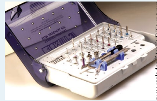
gie-Kit (SLIMKT) und ein prothetisches Starter-Kit gratis dazu.

Durch die Reduktion auf die wesentlichen Bauteile wird es besonders Einsteigern ermöglicht, die häufig doch komplexen Arbeitsschritte in der zahnärztlichen Implantologie sicher zu meistern. Mit der klaren Kodierung entsprechend der benötigten Bohrerprotokolle und den passenden Instrumenten in Griffnähe unterstützt das Kit den Zahnarzt bei einem sicheren und effizienten Workflow. Neukunden macht BIOMET3i ein besonderes Angebot: sie erhalten beim Kauf von 10 T3-Implantaten ein Slim Chirurgie-