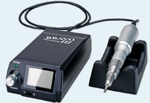
Nach einer Pressemitteilung der Hager & Werken GmbH & Co. KG, Duisburg Internet: www.hagerwerken.de