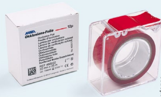
Nach einer Pressemitteilung der Coltène/Whaledent GmbH + Co. KG, Langenau Internet: www.coltene.com

und Produktoptimierung führen zu der bekannten Qualität. HANEL-Okklusionsprüfmittel zeichnen zuverlässig auf jedem Material. Selbst unter schwierigen Bedingungen sowie in unterschiedlichen Anwendungsbereichen ist eine punktgenaue Okklusionsdarstellung gewährleistet. Die Prüfmittel haben die erforderlichen Stärken, Anschmiegsamkeit, Reißfestigkeit und Farbabgabe, sodass punktförmige, flächige oder strichförmige Kontakte und Mikrokontakte sicher aufgezeigt werden.