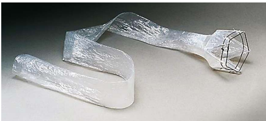
Abb. 1 EndoBarrier® Gastrointestinal Liner.

Allgemeine interventionsassoziierte Ereignisse treten häufig auf. Die häufigsten Ereignisse sind Abdominalschmerzen, Übelkeit, Erbrechen und Diarrhöe, welche gewöhnlich in den ersten Wochen nach Positionierung des Systems auftreten und medikamentös behandelt werden. Die Verankerung im Bulbus duodeni, welche bis in die dort sehr vaskularisierte Submukosa greift, stellt die größte Sicherheit gegen Dislokation, aber auch eine Gefahr für Blutungen und Irritationen dar. Schwere Komplikationen in Form gastrointestinaler Blutungen traten selten auf. Komplikationsbedingt musste das System bei 24% der Patienten frühzeitig entfernt werden. Die häufigsten Gründe dafür sind Migration des Implantats, Blutungen und Obstruktion des Schlauchs. Die Fallzahl in der Literatur wird überwiegend durch Studien mit einem Prototypen geprägt. Durch Erfahrungswerte mit dem Instrument, spezielle Schulung der Endoskopiker, Verbesserung der Befestigungstechnologie und der Lokalisierung der Verankerung, konnten die Komplikationen in neueren