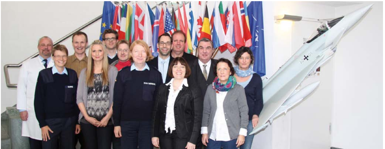
Erste Sitzung im Januar 2014: Das ‚neue Team‘ übernimmt vom ‚alten Team‘.

‚neuen‘ und ‚alten‘ Team vorbehalten. Diese galt vor allem dem gegenseitigen Kennenlernen, der Strukturierung und Schwerpunktsetzung sowie der Verteilung der Aufgaben in der kommenden Vorstandsarbeit und natürlich, ganz wichtig, der Vorbereitung der Jahrestagung der DGLRM 2014.