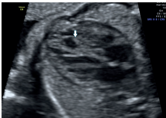
Fig. 1 Aneurysmal dilation at the apex of the ventricular septum Abb. 1 Aneurysmale Dilatation am Apex des Kammerseptums

A 27 years old gravida 3 para 2 was referred for an expert follow up of an atypical ventricular septal defect suspected during routine obstetrical screening ultrasound. The 4-chamber view showed an aneurysmatic structure at the apex of the ventricular septum (◊ Fig. 1) shunting into the right ventricle as visualized by color Doppler (◊ Fig. 2). Closer examination revealed a tortuous structure draining into the distal part of the aneurysma and connected to an enlarged ramus interventricularis of the left coronary artery (◊ Fig. 3). The short axis view showed a dilated origin