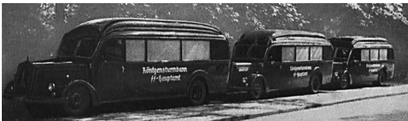
Abb. 3: Ein Röntgenzug mit drei Röntgenwagen des Röntgensturmbannes-SS-Hauptamt (Quelle: Der Deutsche Militärarzt 4 (1939), Abb. 1, S. 493, Springer-Verlag).]