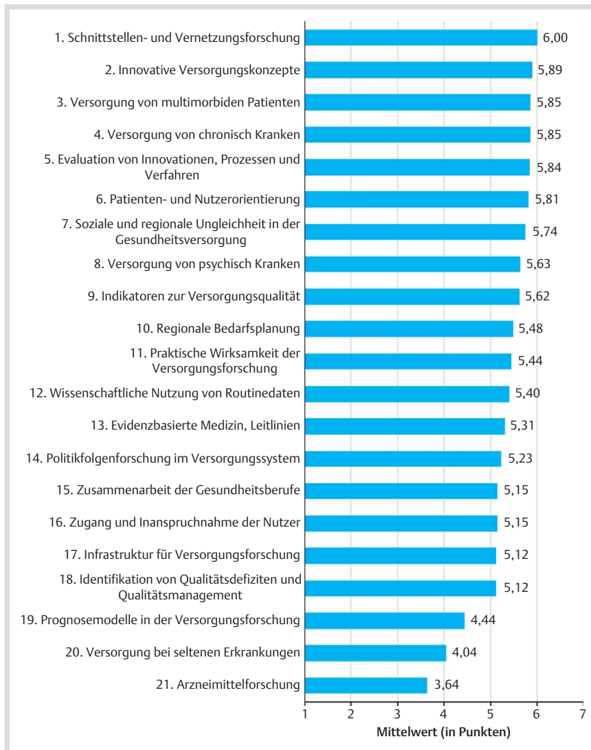
Abb. 2 Wichtigkeit von Themen der Versorgungsforschung in Zukunft in Bayern aus Sicht der Mitglieder der Bayerischen Landesarbeitsgemeinschaft Gesundheitsversorgungsforschung (LAGeV). Mittelwerte basieren auf einer 7-stufigen Likert-Skala von 1 (ganz und gar unwichtig) bis 7 (ganz und gar wichtig).