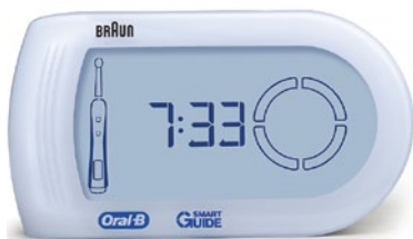
Abb. 7 ... mit SmartGuide

Dieser Beitrag entstand mit freundlicher Unterstützung der Procter & Gamble Germany GmbH, Schwalbach am Taunus