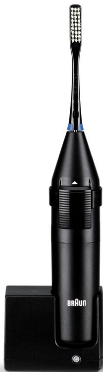
Abb. 2 Braun D1