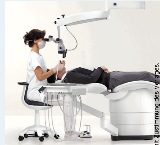
Nach einer Pressemitteilung der J. Morita Europe GmbH, Dietzenbach Internet: www.morita.com/europe

Röntengeräte für Einzelzahnaufnahmen und Digitale Volumentomografen (DVT) zur Darstellung komplexer Strukturen an, wobei alle Systeme gemäß dem ALARA-Prinzip eine sehr geringe Strahlenbelastung aufweisen. Den fließenden Übergang von der Diagnose zur Therapie unterstützt die ergonomische Behandlungseinheit Soaric. Sie ist für endodontische Behandlungen entwickelt worden, setzt auf intuitive Greifwege für die Instrumente, integriert intelligente Ablagemöglichkeiten und bietet mit einem innovativen Design ein hohes Maß an Liegekomfort für den Patienten. Auch für die weiteren Arbeitsschritte – Trepanation, Aufbereitung, Behandlung und Kontrolle – bietet Morita Instrumente und Systemlösungen für einen runden und erfolgreichen Ablauf.