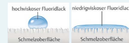
Hochviskoser Lack steht auf der Oberfläche. Niedrigviskoser Lack Fluor Protector S dringt in die Oberfläche ein.