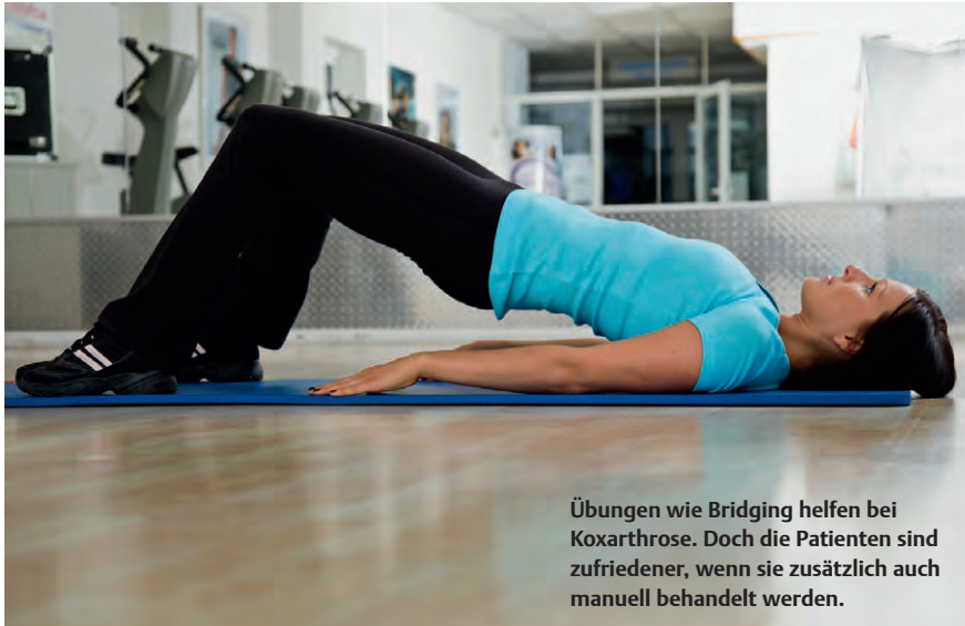
Übungen wie Bridging helfen bei Koxarthrose. Doch die Patienten sind zufriedener, wenn sie zusätzlich auch manuell behandelt werden.