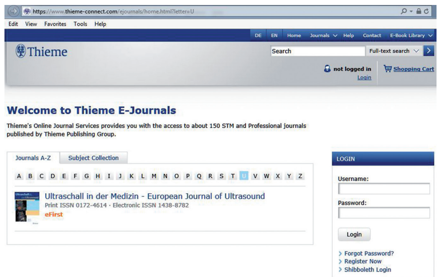
Fig. 1 Velkomstsiden Thieme E-Journals

Men også uten abonnementsnummer – bare hopp over feltet – fullføres registreringen og en har umiddelbart tilgang til aktuelle årgangen. Full tilgang etableres i løpet av maks 1 uke, når Thieme har verifisert abonnementsopplysninger. En får da opp Ultraschall in der Medizin tilbake til 1. utgave i 1980 og kan i „Search“ feltet søke gjennom alle utgaver i enten