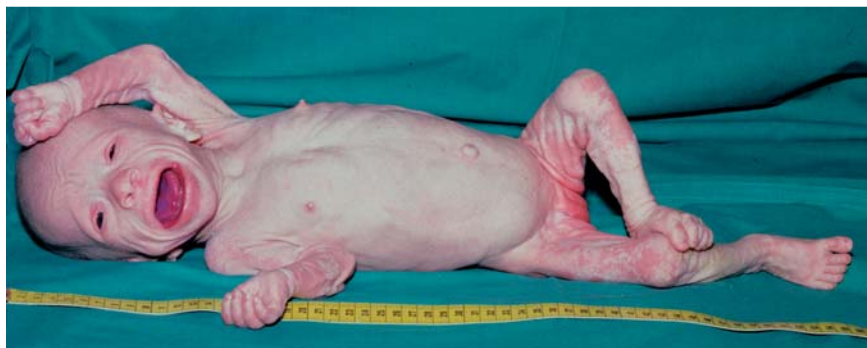
Abb.7 Harlekin-Baby bei Ichthyosis congenita gravis, mit übergroßer, rundovaler Mundöffnung und angeborener generalisierter hyperkeratotischer Ichthyose des ganzen Integumentes.

–21]. Sie sind nicht wegzudenken, ebenso wenig wie deren Modifizierung durch die Kosmetik. Schönheit steht im Zentrum und erwirkt Wohlgefallen. Eros aber, der allgegenwärtige und unbesiegbare, verwandelt das Verlangen in „begehrliche Liebe“ und ruft zur Tat. Die gefällige Schönheit wandelt sich unvermittelt zur erotischen Attraktion. Die dazu bedeutsamen Elemente sind die Übersteigerung der Augenhorizontalen und vor allem die Betonung von Form und Farbe der Mundpartie. Dies ist das Feld der modernen Kosmetik mit all ihren Erfolgen und Fallstricken. Beispiele belegen dies. In ► Tab.1 wird versucht, die