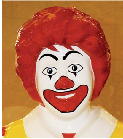
Abb. 3 Der Clown Ronald McDonald. Der komische Ausdruck wird erreicht durch Reduzierung der Augenhorizontalen auf die zwei Augen, durch eine weiße Gesichtabdeckung und die rote Überzeichnung der Lippen. Komisch als ein gewisser Gegensatz zu schön.

Am Beispiel Clown ist ersichtlich, dass eine Betonung der Mundpartie nicht in jedem Fall zur erwünschten Steigerung der Attraktivität führt, sondern kippen kann zum Komischen einerseits, oder dann zur Hässlichkeit bis zum Schrecklichen als extreme Kulmination. Dies gilt es, nochmals zu differenzieren. Mund und Mundpartie sind zentral im menschlichen Gesicht platziert. Sie stellen somit auch den zentralen Blickpunkt dar bei der Gesichtserkennung und den damit verbundenen Emotionen. Da es sich zugleich um eine starke erogene Zone handelt, ist es verständlich, dass sich um und durch Mund und Mundpartie besonders prononcierte erotische Affektionen drehen und entwickeln. Das Verlangen ( Himeros ) wird erweckt und Eros drängt zur Tat, dem Kuss. Viel geschehen, oft beschrieben, kann man Sophokles („Eros ist unbesiegt“) verstehen und Sigmund Freud ebenso. Es liegt auf der Hand, dass die freizügige Kosmetik dem Verlangen