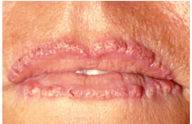
Abb. 4 Markierung und Betonung des Lippenrandes als permanentes Make-up mit nachfolgender granulomatöser Überreaktion, eine schwerwiegende Nebenwirkung.

nach Steigerung dieser vorgerichteten Abläufe durch entsprechende Modifizierung der Mundpartie in vielfältiger Weise nachzukommen bemüht ist. Die betrifft sowohl die Farbe als auch die Größe und die Form, oder besser die Verformung.