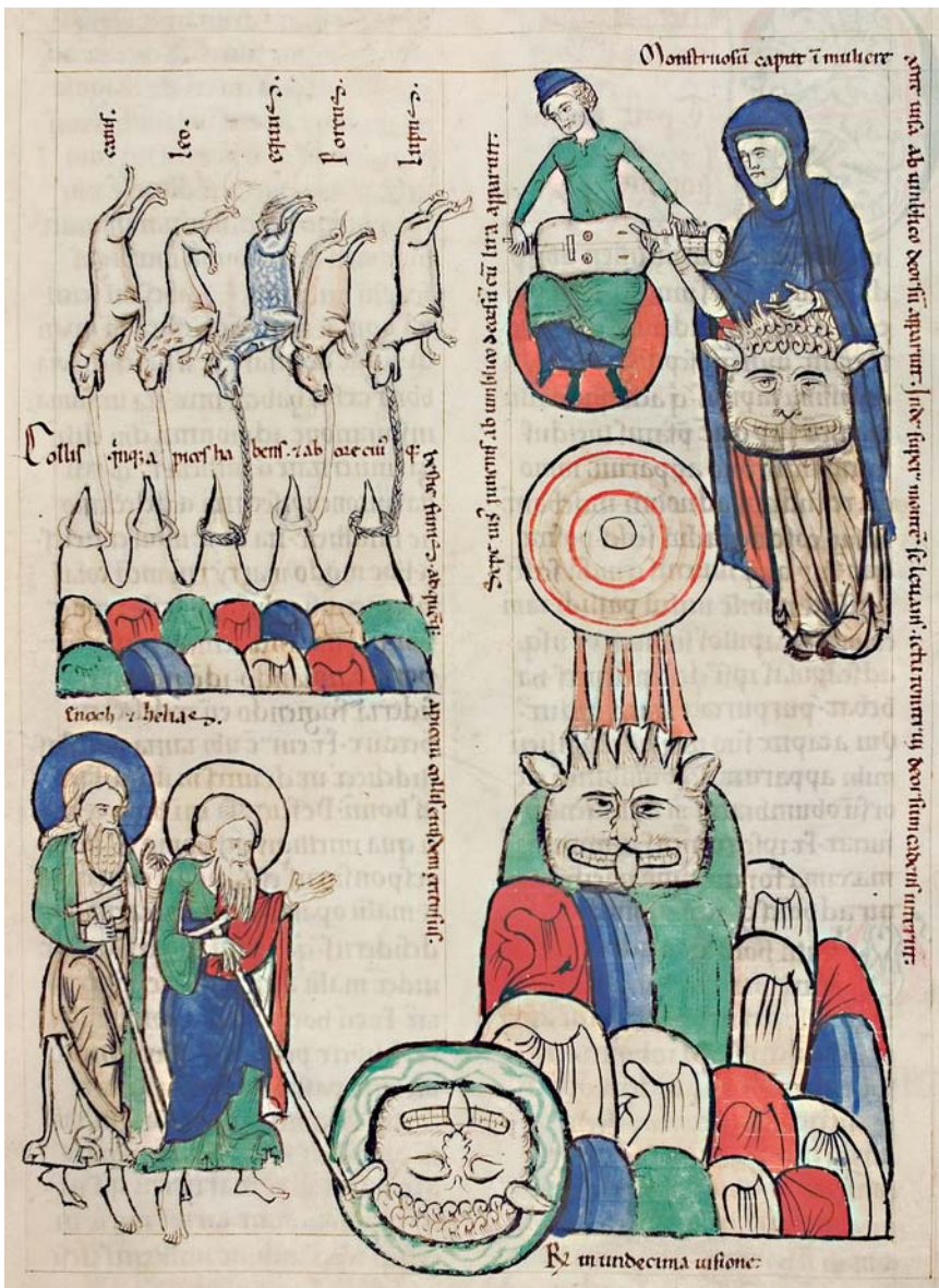
Abb. 1 Hildegard von Bingen: Liber Scivias III, 11; Rechts oben die blaue Figur als Allegorie der Kirche ist beschäftigt mit dem „Haupt des Bösen, mit eselsgleichen Ohren und mit Nase und Rachen wie ein Löwe“, welches in der Bildmitte anmaßend sich erhebt und endlich bewältigt, abgestürzt und tot (verkehrt) am unteren Bildrand liegt (Bild: UB HD: Cod. Sal. X,16: fol. 177r).

Vorwiegend sind es Menschenmasken, gelegentlich mit Tierattributen. Die Bildererkennung [7, 13] erfolgte anhand der Augenhorizontalen und der besonders pointiert bezeichneten Gesichtsvertikalen mit Nasenbetonung. Charakterisiert werden die Masken oft als Clowns, Gaukler, Fastnachtsfiguren und seltener als Teufel, Gasmaske oder Totenmaske. Betont wird regelmäßig das Groteske, das Grimmige, das Hässliche, sowie Karikatur und Verfremdung. Ästhetik als Schönheit und Attraktivität wird kaum angeführt.